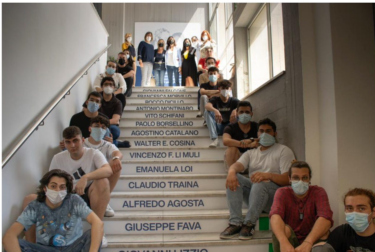
Una scala come metafora di un esercizio quotidiano della memoria.